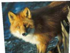
Monsieur Rusé, le renard roux