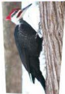
Monsieur Picard, le grand pic