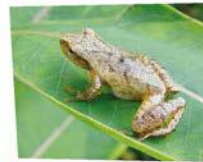
Mme X, la rainette crucifère