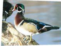
Docteur Aucoin, le canard branchu