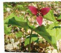
Mme Lafleur, la trille rouge